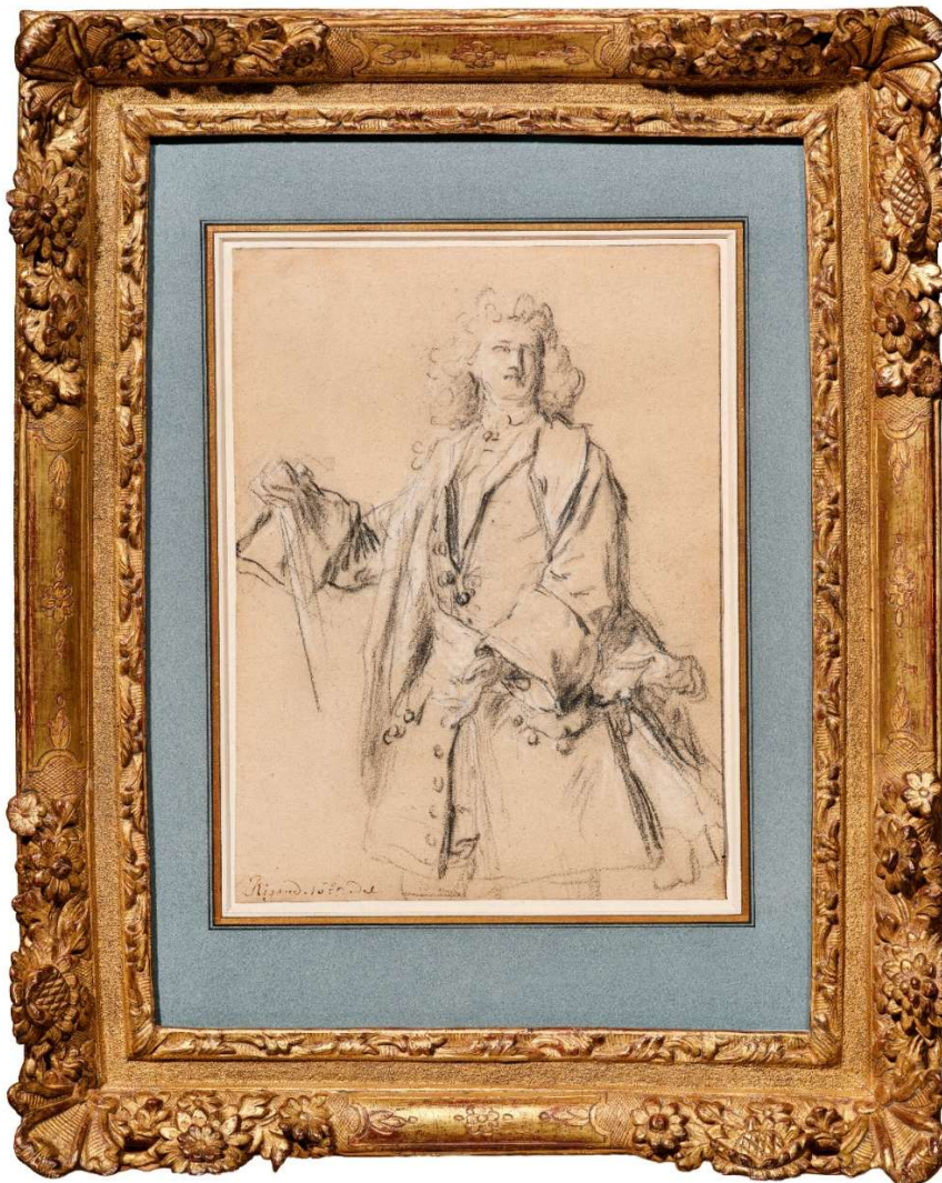
Nicolas de Largillière - Etude pour le portrait d'un gentilhomme

Nous avons choisi pour ce dessin un cadre Louis XIV à coins fleuris de la Maison Lebrun.