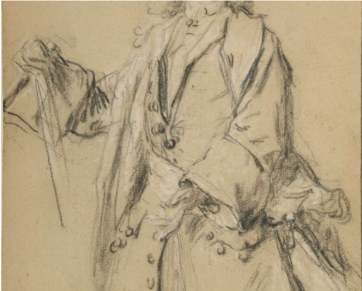
Nicolas de Largillière - Etude pour le portrait d'un gentilhomme (détail)

Légèrement plus abouti, notre dessin représente un gentilhomme de trois-quarts, la main droite appuyée vraisemblablement sur un bâton de commandement et la main gauche ouverte, le bras le long du corps. Celle-ci fait l'objet d'une attention particulière de l'artiste, qui la rend très expressive alors même qu'elle est rapidement esquissée. A l'instar du dessin du Louvre reproduit ci-dessus les deux mains sont traitées différemment, la main gauche tout en rondeur tandis que celle de droite est schématisée de manière géométrique.