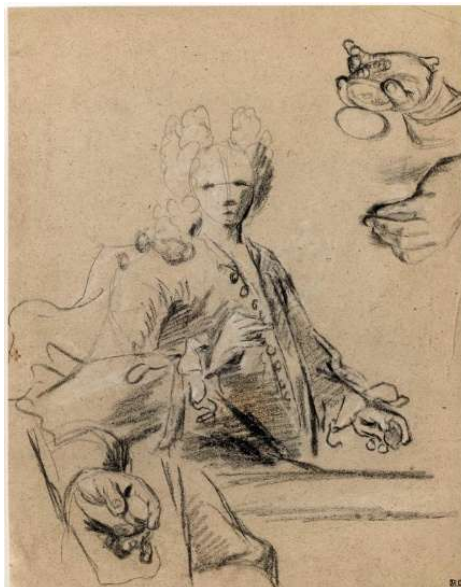
Nicolas de Largillière - Etude d'homme en négligé (Inv. RF 54900) - Musée du Louvre - Paris

Nous connaissons de sa main sept académies (six à l'École Nationale des Beaux-Arts et une au Metropolitan Museum de New York) datant toutes de ses années de professeur à l'Académie vers 1705-10. Trois dessins préparatoires à des portraits lui ont été récemment attribués 2 : une étude de femme chantant en vue du Portrait de Famille du Louvre conservée au Courtauld Institute de Londres, une Etude de cinq portraits et d'une draperie à la sanguine rehaussée de craie noire et blanche, autrefois attribuée à François de Troy, qui lui est aujourd'hui rendue (collection privée) et une Etude d'homme en négligé à la pierre noire et à la craie blanche, acquise en 2011 par le musée du Louvre. A ce corpus s'ajoutent trois études de mains, deux aux trois crayons et l'une uniquement à la pierre noire et à la craie blanche. C'est de l'étude du Musée du Louvre qu'il nous paraît le plus intéressant de rapprocher notre portrait.