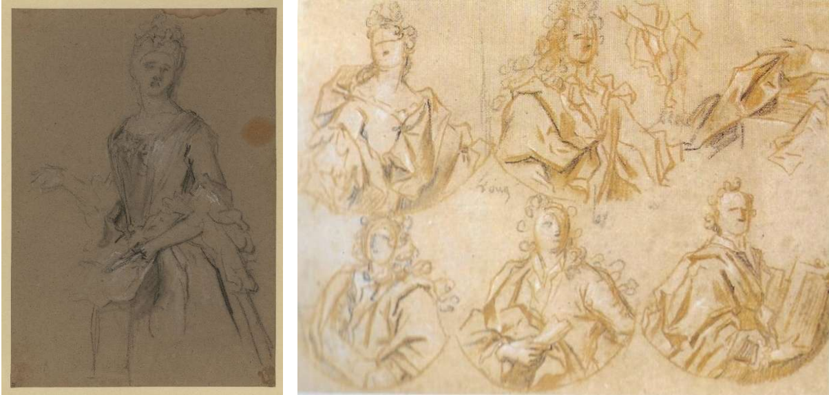
Nicolas de Largillière - A gauche Jeune femme à mi-corps chantant - vers 1715 (Inv. D.1952.RW.4486) The Courtauld, London (Samuel Courtauld Trust) - A droite Feuille d'études de cinq portraits et d'une draperie vers 1695-1700 - collection particulière

Nous connaissons de sa main sept académies (six à l'École Nationale des Beaux-Arts et une au Metropolitan Museum de New York) datant toutes de ses années de professeur à l'Académie vers 1705-10. Trois dessins préparatoires à des portraits lui ont été récemment attribués 2 : une étude de femme chantant en vue du Portrait de Famille du Louvre conservée au Courtauld Institute de Londres, une Etude de cinq portraits et d'une draperie à la sanguine rehaussée de craie noire et blanche, autrefois attribuée à François de Troy, qui lui est aujourd'hui rendue (collection privée) et une Etude d'homme en négligé à la pierre noire et à la craie blanche, acquise en 2011 par le musée du Louvre. A ce corpus s'ajoutent trois études de mains, deux aux trois crayons et l'une uniquement à la pierre noire et à la craie blanche. C'est de l'étude du Musée du Louvre qu'il nous paraît le plus intéressant de rapprocher notre portrait.