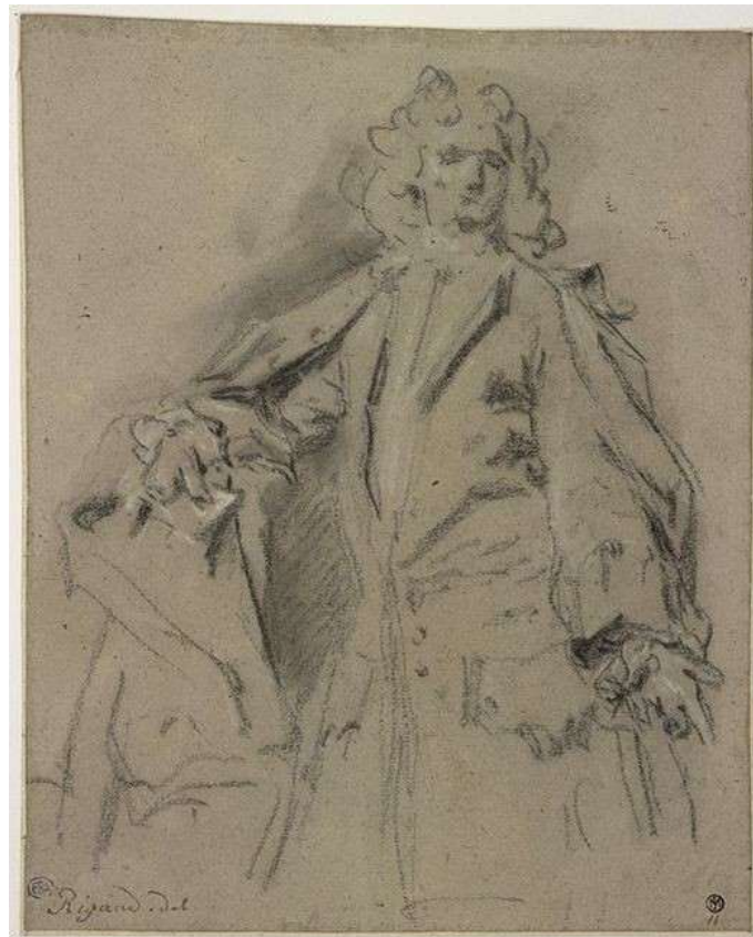
Hyacinthe Rigaud (?) - Portrait d'un gentilhomme à mi-jambes, de face, la main droite appuyée sur un meuble et tenant une lettre (Inv. Mas. 1180 recto) - Ecole Nationale Supérieure des Beaux-Arts - Paris

L'Ecole nationale des Beaux-Arts possède dans ses collections un ensemble de quatre feuilles (dont l'une est double face) qui sont assez proches de celui que nous présentons et qui sont répertoriées sur le site internet de L'Ecole nationale des Beaux-Arts comme des œuvres de Rigaud 3 . Bien que l'une d'entre elles soit signée à la plume « Rigaud. del » (sans mention de date), d'une écriture semblable à celle de la signature de notre dessin, les spécialistes de Rigaud s'accordent aujourd'hui pour exclure ces dessins du corpus de Rigaud et pour considérer cette signature comme apocryphe 4 .