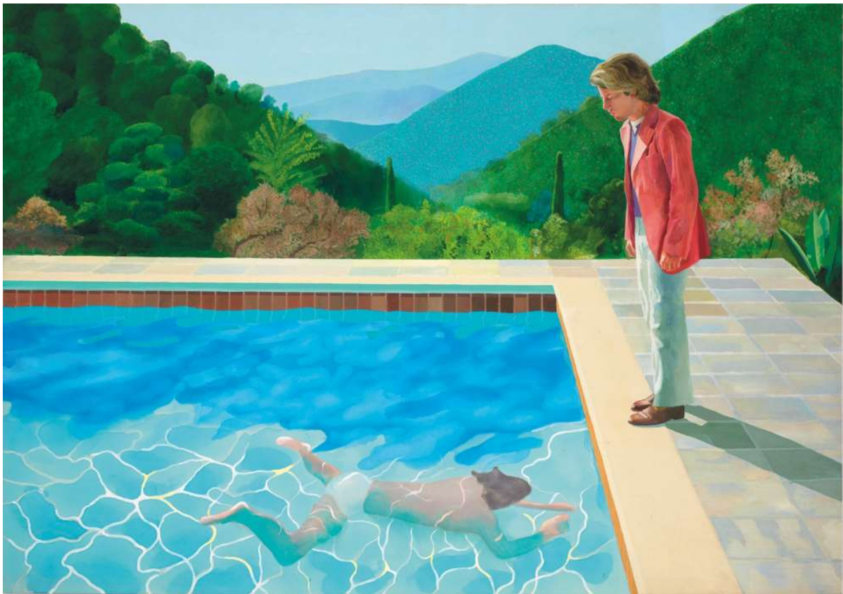
David Hockney - Portrait d'un Artiste (1972)